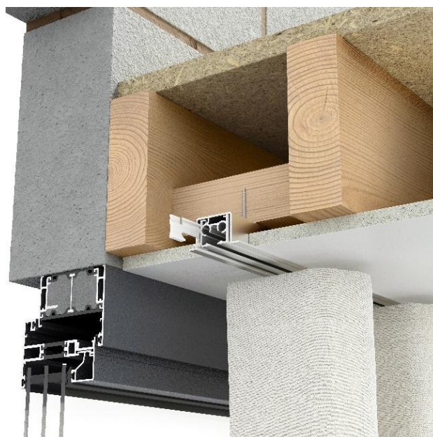
Perfil de encastrado + riel encastrado + inserto